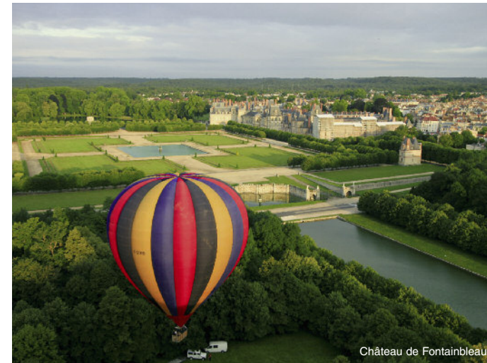
Château de Fontainebleau