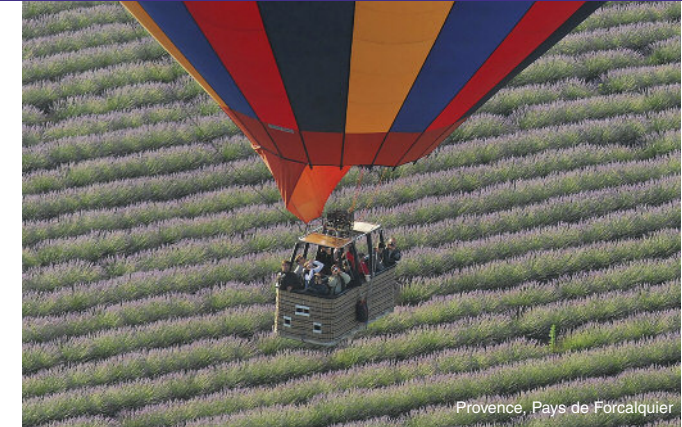
Provence, Pays de Forcalquier

Balloon flights take place at sunrise or just before sunset when the winds are calm, the air cool and stable. You need to allow around 3 hours for your adventure, this includes the balloon preparation and inflation not to be missed. Once aboard, you float away for approximately one hour. The ground crew, who follow the balloon during the flight, greet you at the landing for the traditional "toast des aéronautes" a convivial celebration in the French countryside, before escorting you back to the departure point.