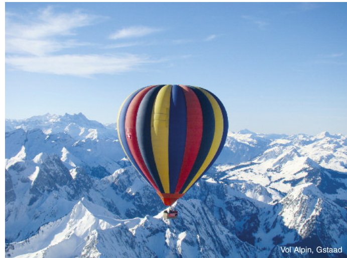
Vol Alpin, Gstaad

Nous vous donnons rendez-vous au lever ou au coucher du soleil lorsque les vents sont stables. Après le gonflage du ballon, spectacle impressionnant, vous prenez place à bord de la nacelle pour environ une heure de vol au gré du vent. Sans itinéraire précis, laissez-vous porter pour frôler la cime des arbres ou toucher du doigt les nuages, sans la moindre impression de vertige. Pendant le vol, le pilote est en contact avec l'équipe au sol qui vient vous accueillir à l'atterrissage. Vous dégustez ensuite le traditionnel « Toast des Aéroliers » tout en