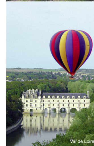
Val de Loire